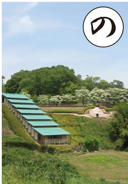
「おりべのさとこうえん」ののほりがま（ひだり）とおおがま（みぎ）