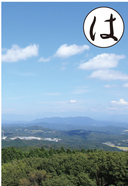
みくにやまからみたあいちけんのふうけい