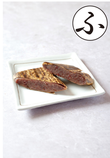
たけがわようかん