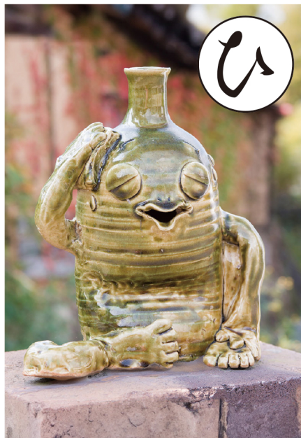
とっくりとっくん